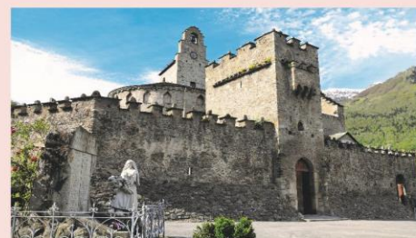
Eglise fortifiée de Luz-Saint-Sauveur