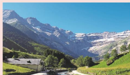
Le Cirque de Gavarnie

Petit déjeuner. Retour vers la ville d'origine avec un panier repas à emporter.