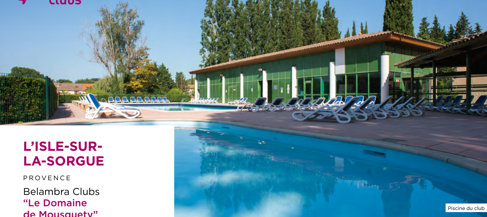
Piscine du club