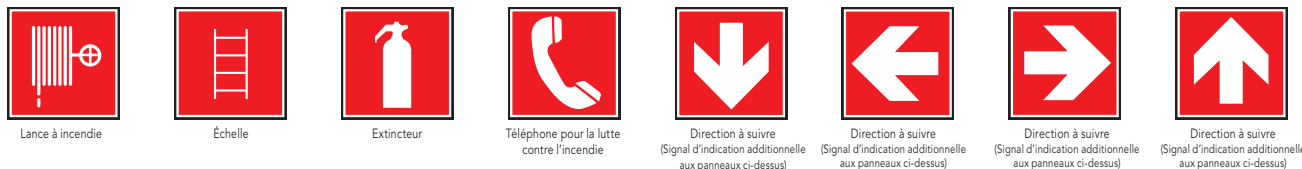
Lance à incendie Échelle Extincteur Téléphone pour la lutte contre l'incendie Direction à suivre (Signal d'indication supplémentaire aux panneaux ci-dessus) Direction à suivre (Signal d'indication supplémentaire aux panneaux ci-dessus) Direction à suivre (Signal d'indication supplémentaire aux panneaux ci-dessus) Direction à suivre (Signal d'indication supplémentaire aux panneaux ci-dessus)