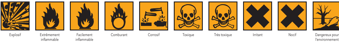
Explosif Extrêmement inflammable Facilement inflammable Comburant Corrosif Toxique Très toxique Irritant Nocif Dangereux pour l'environnement