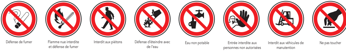
Défense de fumer Flamme nue interdite et défense de fumer Interdit aux piétons Défense d'éteindre avec de l'eau Eau non potable Entrée interdite aux personnes non autorisées Interdit aux véhicules de manutention Ne pas toucher