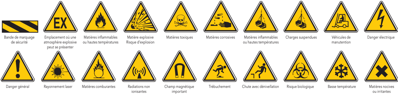
Bande de marquage de sécurité Emplacement où une atmosphère explosive peut se présenter Matières inflammables ou hautes températures Matière explosive Risque d'explosion Matières toxiques Matières corrosives Matières inflammables ou hautes températures Charges suspendues Véhicules de manutention Danger électrique Danger général Rayonnement laser Matières combustibles Radiations non ionisantes Champ magnétique important Trébuchement Chute avec dénivelation Risque biologique Basse température Matières nocives ou irritantes