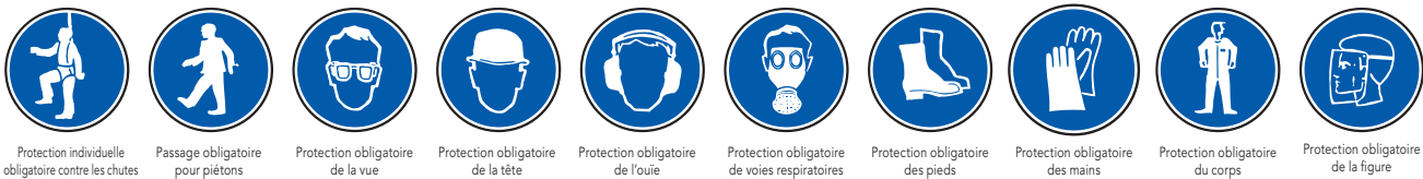
Protection individuelle obligatoire contre les chutes Passage obligatoire pour piétons Protection obligatoire de la vue Protection obligatoire de la tête Protection obligatoire de l'ouïe Protection obligatoire de voies respiratoires Protection obligatoire des pieds Protection obligatoire des mains Protection obligatoire du corps Protection obligatoire de la figure