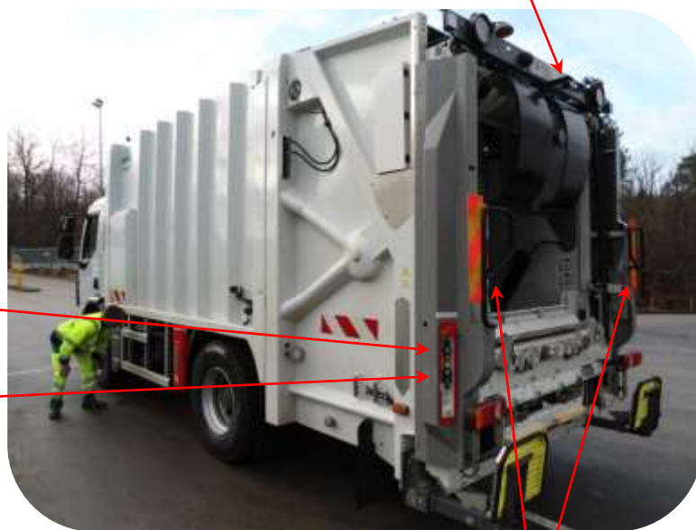
Les arrêts d'urgence