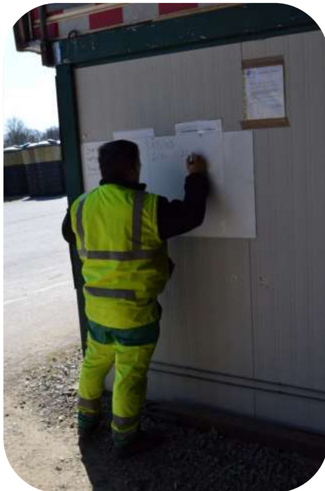
Exemple de tableau de remontée d'informations

Utiliser pour cela les fiches ou le matériel spécifique de la collectivité .